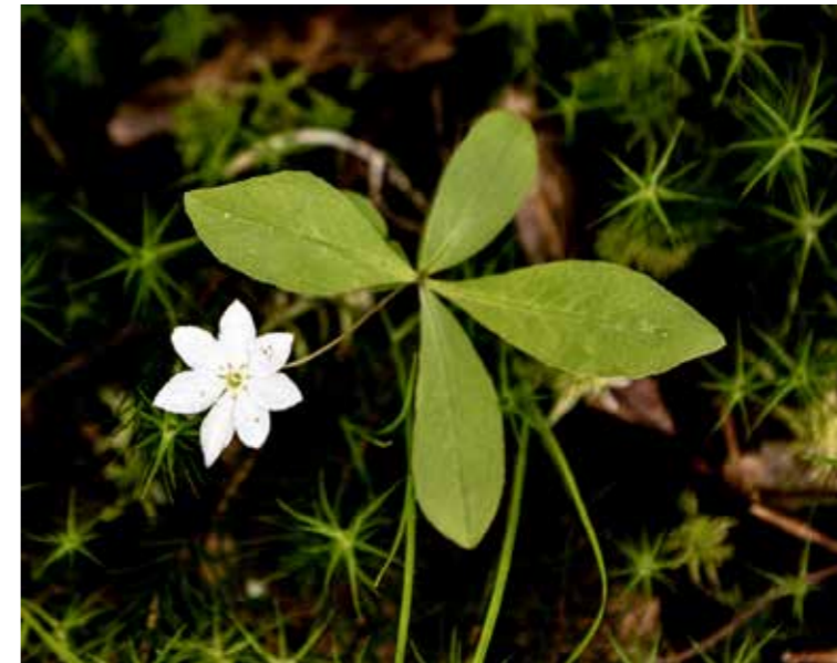
Skogsstjärna, Värmlands landskapsblomma. Starflower, the county flower of Värmland.